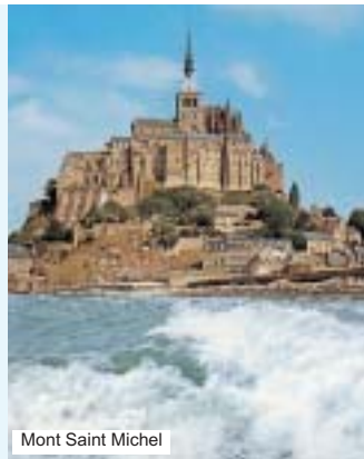
Mont Saint Michel

Onze dies per a visitar Beaune, Fontainebleau, París, Versailles, Lisieux, Honfleur, Caen, Mont St. Michel, Saint Malo, Nantes, Burdeos.