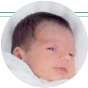
ALCÁZAR DE SAN JUAN: En acció de gràcies a santa Teresina perquè el meu nét ha passat bé la segona prova de l'oïda, publico la seva fotografia. M. J. R.