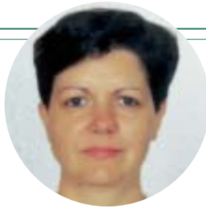
ARTESA DE SEGRE: Agraïda. A. P.